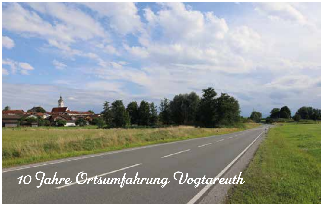
Umgehungsstraße Vogtareuth 2025

AIGN BENNING BUCH EGLHAM EGLLACK EICHBICHL ENTBERG ENTFELDEN ENTMOOS FARMACH FORST GAFFL GMAIN HAID HOFSTÄTT HÖLKING HOLZLEITEN KALKGRUB KNOGL LEITEN LOCHEN LUEG OBERWINDERING OED PIRACH RACKERTING REIPERSBERG RIED SCHNEIDERWIES SEEHUB SEELEITEN SEPPL IM HOLZ STRAßKIRCHEN STRAßÖD SULMARING SUNKENROTH TÖDTENBERG UNTERSEE UNTERWINDERING VETTL VIEHHAUSEN VOGLEITEN WALL WEIDACH WEIKERING WINKL ZAIßBERG ZAISERING ZIELLECHEN