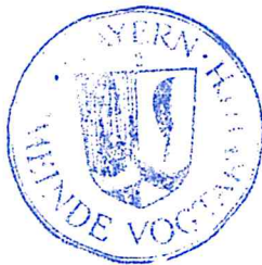
Rudolf Leitmannstetter Erster Bürgermeister