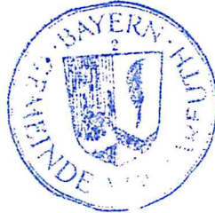
Rudolf Leitmannstetter Erster Bürgermeister